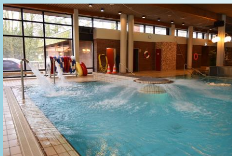
Brust- und Nackenduschen